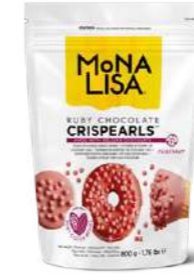
Crispearls™ Ruby Mona Lisa® CHR-CC-2CRISE0-02B