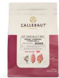
Cobertura Ice-Choc Ruby RB1 Callebaut® ICE-43-RUBY-552