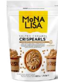
Crispearls™ caramelo salado Mona Lisa® CHF-CC-CCRISE0-02B