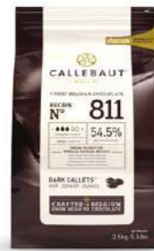
Cobertura de chocolate negro 811NV Callebaut® 811-E5-U71