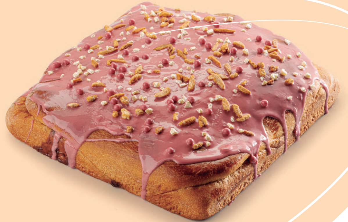
Coca de brioche rellena