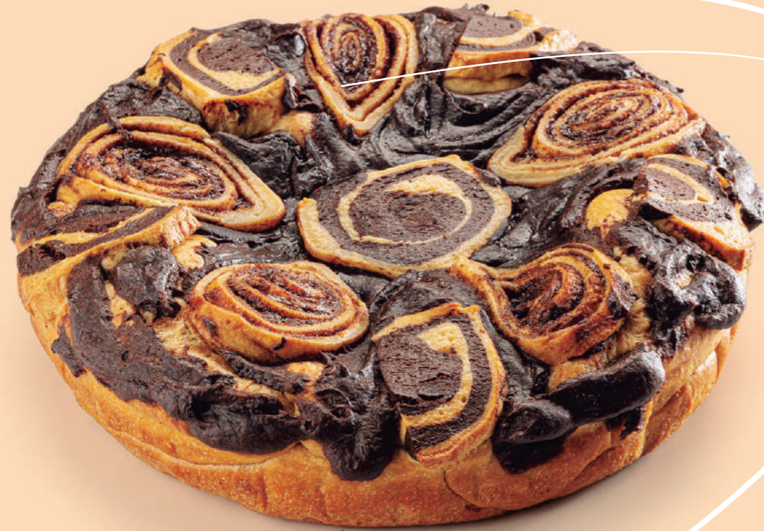
Coca brioche de verbena