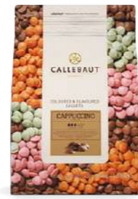
Cobertura color y sabor Cappuccino Callebaut® CAPPUCCINO-E5-U70