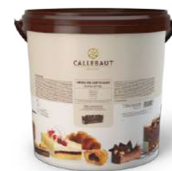
Crema dell'artigiano Bitter Callebaut® V21-OH35NV-T06