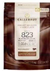
Cobertura de chocolate con leche 823NV Callebaut® 823-E5-U71