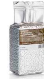
Bastones de almendra caramelizados Chocovic® PRN-HA50C2CV-T61