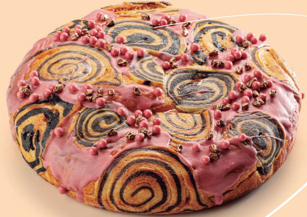
Coca brioche de verbena