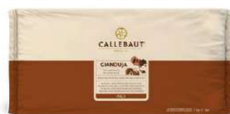
Gianduja leche Callebaut® GIA-144