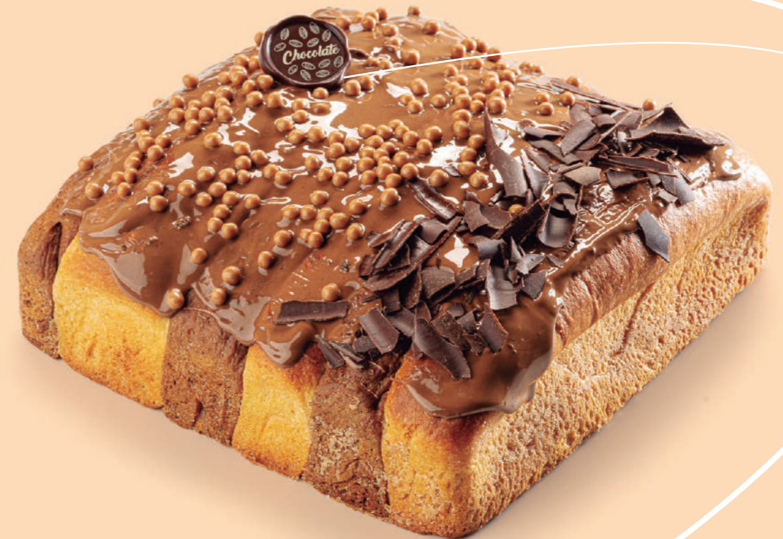
Coca de brioche