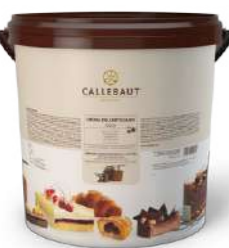
Crema dell'artigiano Gold Callebaut® FNN-Q8038-T06