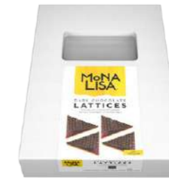
Láminas de chocolate negro Mona Lisa® CHD-GD-19838E0-999