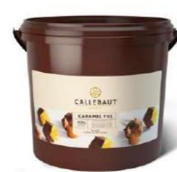
Relleno de Caramelo Callebaut® FWF-Z6CARA-X10