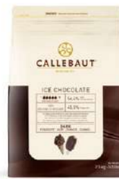
Cobertura Ice-Choc 811 Callebaut® ICE-45-DNV-552