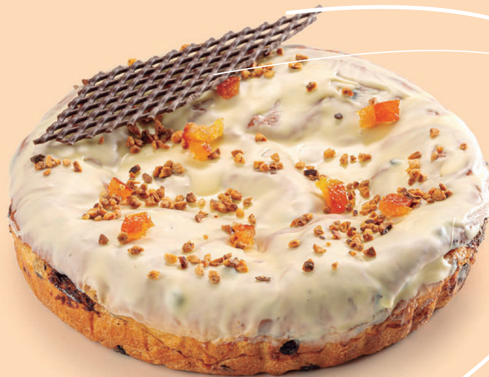
Coca de brioche rellena