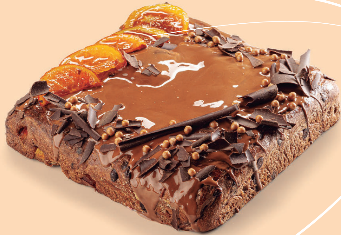
Coca de brioche