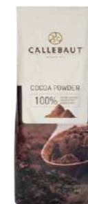
Cacao en polvo CP Callebaut® CP-E0-776