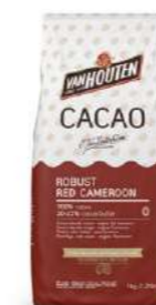
Cacao en Polvo Robust Red Cameroon Van Houten DCP-20R118-VH-760