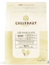
Cobertura Ice-Choc W2 Callebaut® ICE-50-WNV-552