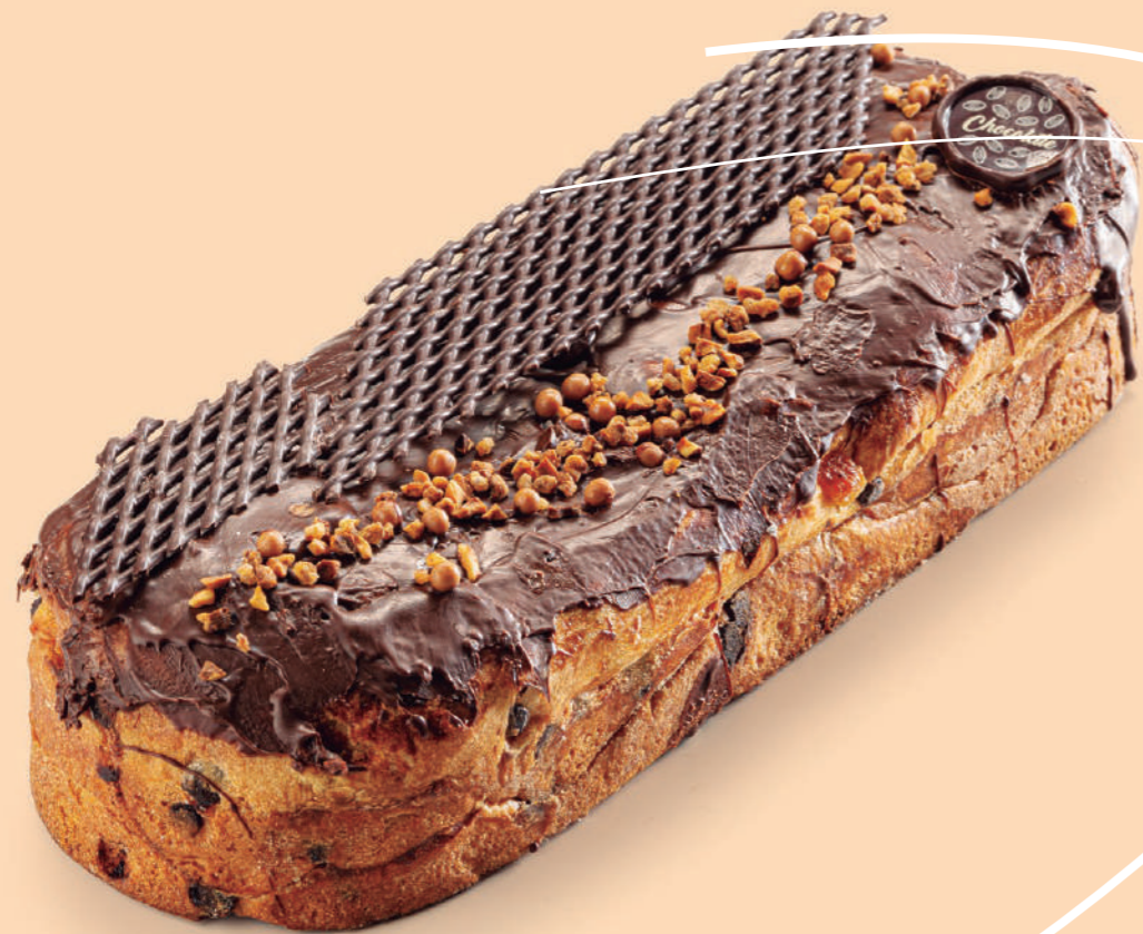
Coca de brioche rellena