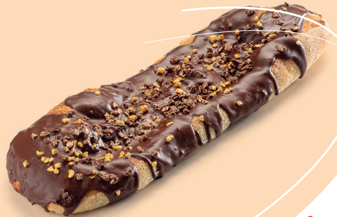
Coca de pan