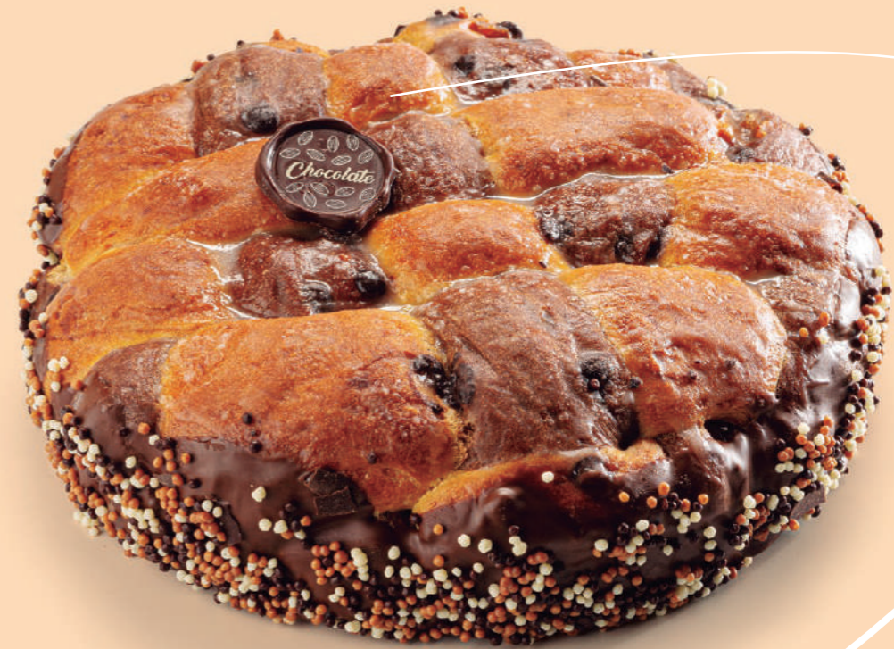
Coca de brioche