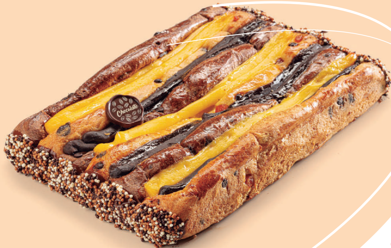
Coca de brioche rellena