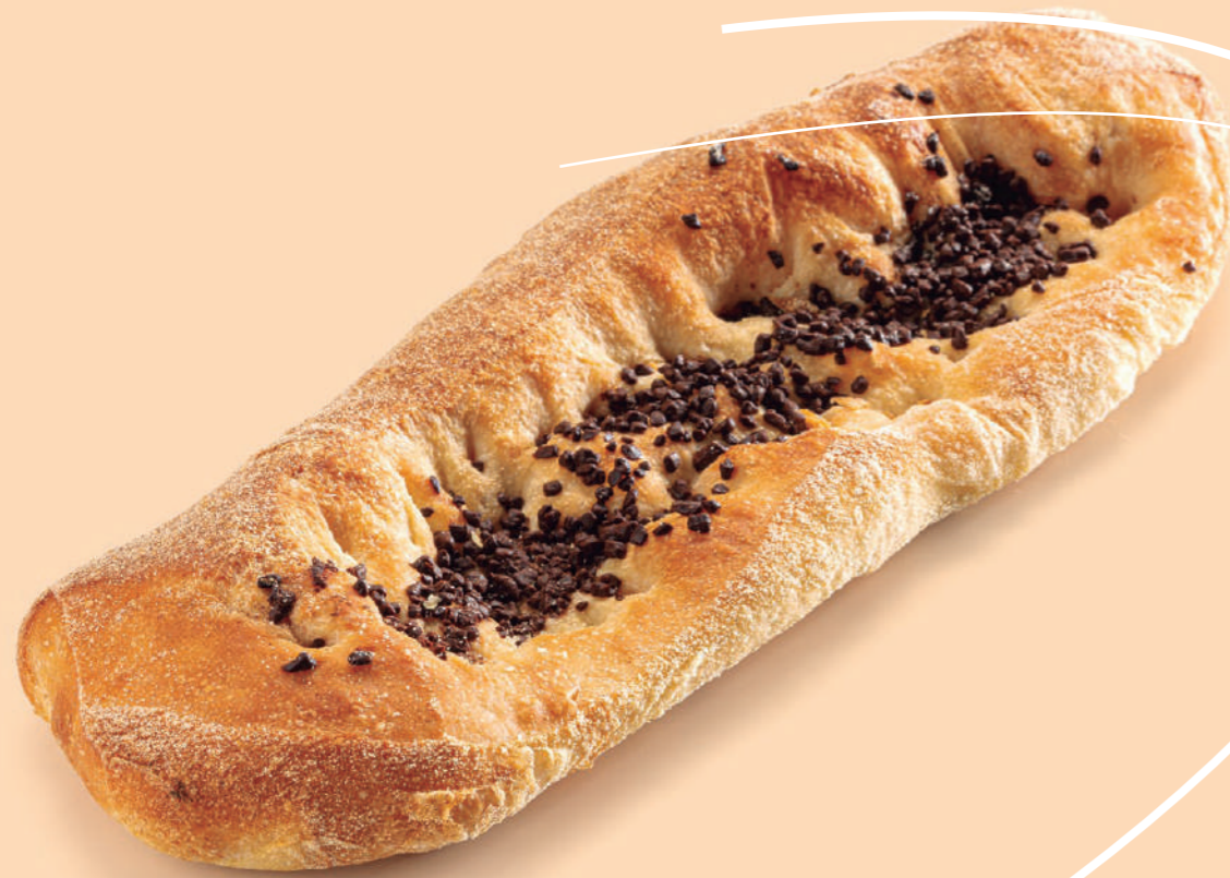
Coca de pan