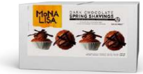
Virutas de chocolate negro Mona Lisa® CHD-SV-22206E0-08B