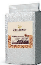
Crocanti avellanas Callebaut® NAN-CR-HA3714-U11