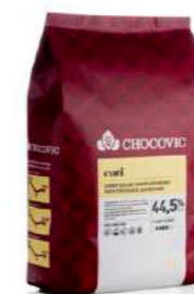
Gotas Cori horneables Chocovic® CHD-DR-90CORI-D38