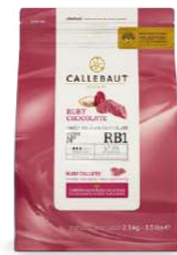
Chocolate Ruby RB1 Callebaut® CHR-R35RB1-E5-U70