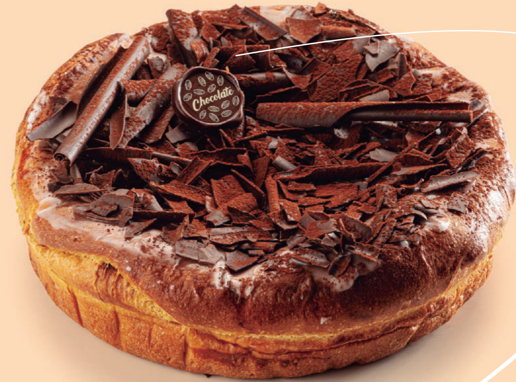
Coca de brioche rellena