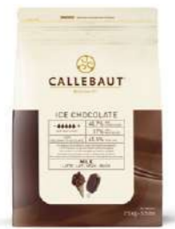
Cobertura Ice-Choc 823 Callebaut® ICE-45-MNV-552