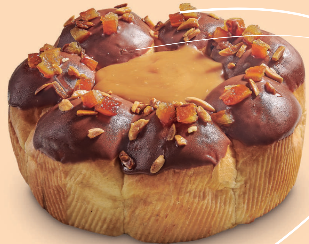
Coca brioche de verbena