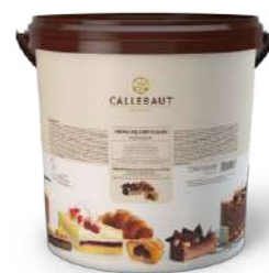
Crema dell'artigiano Nocciola Callebaut® N05-OH40-T06